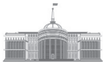
Жолдау мұраты – ел мүддесі

Президент Қасым-Жомарт Тоқаев Қазақстан халқына жолдаған кезекті Жолдауында зейнетақы жүйесінің тиімділігін арттыру бойынша жаңа